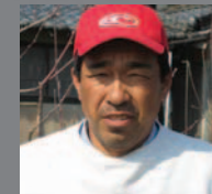
桃 すもも ぶどう

出荷量は南アルプス市でもトップクラス。 お客様に安心・安全のおいしい果物を 提供することがモットー。肥料に関する 知識が豊富。有機質のものを主に使用。