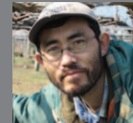
ぶどう さくらんぼ すもも 桃

通称ぶどう仙人。高級ぶどう50種類を 栽培し主に都内に出荷。独自開発品種は なんと13種！環境にやさしい土づくり を基準に安心の果物づくりを目指す。