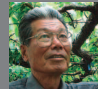
すもも 貴陽 ぶどう

幻フルーツ「貴陽」(高級すもも)開発者。 すもも太陽を基に試行錯誤を繰り返し、 20年の歳月を掛け開発した。 貴陽づくりの第一人者。