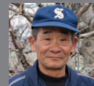
あんぽ柿 キウイ さくらんぼ

あんぽ柿づくりの名人。 新しい農業技術を取り入れ、研究熱心な 南アルプス冬季限定加工フルーツの 魅力を伝える貴重な存在。